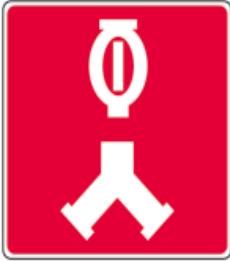
Raccords-pompiers pour le réseau de gicleurs