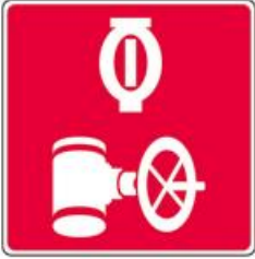
Valve du réseau de gicleurs