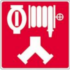
Raccords-pompiers pour le réseau de gicleurs et les cabinets d'incendie