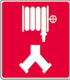
Raccords-pompiers pour les cabinets d'incendie