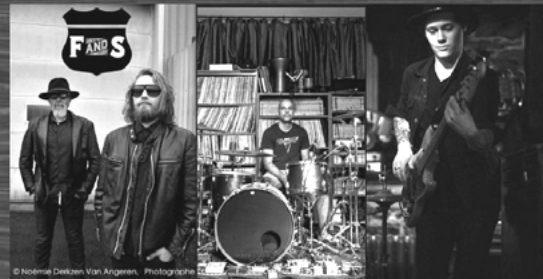
FATHER'N'SON AND FRIENDS

PRIX : 45 $ | BAR ET CASSE-CROÛTE SUR PLACE! 19 h - Ouverture des portes à 18 h