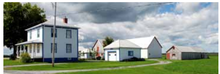
Exemple d'implantation de bâtiments secondaires à favoriser, avec notamment l'aménagement du garage de manière à réduire son impact visuel, La Présentation